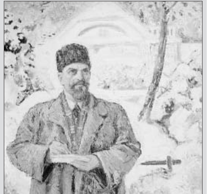
«Autoportrait» de L'Eplattenier de 1942.

«L'histoire d'une œuvre», Musée des beaux-arts de La Chaux-de-Fonds, jeudi 2 décembre à 20h