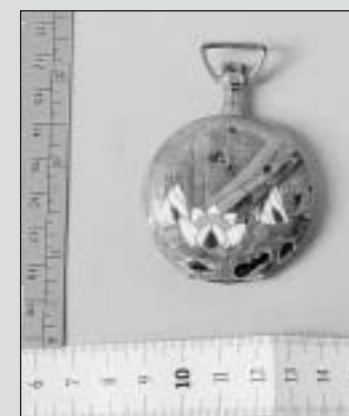
Une boîte de montre réalisée par un élève de l'Ecole d'art vers 1906. PHOTO ÉCOLE D'ART

L'accès à ce corpus est réservé, avec un code, à la Ville et aux institutions concernées. Il sera vraisemblablement