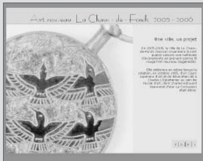
La page de garde du site internet artnouveau.ch

L'internaute pourra notamment se renseigner sur les événements à venir ainsi que sur le sens même de l'Art nouveau. Une galerie de photos permet aussi au visiteur de se faire une idée plus précise de l'importance de ce style artistique dans la cité horlogère. Des cages d'escalier aux vitraux, en passant par l'architecture, la ferronnerie ou le carrelage et la faïence, le Style sapin fait fureur.