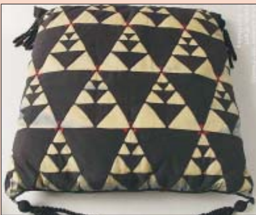
Coussin d'époque (collection Ecole d'art) et patchwork (E. Reber) en Style sapin revisité.

La peinture sur porcelaine est également un art qui a bien servi l'Art nouveau. Aux Bulles, Eliane Porret va y consacrer cinq leçons (dès janvier 2006), pour débutants ou chevronnés (tél. 032 968 09