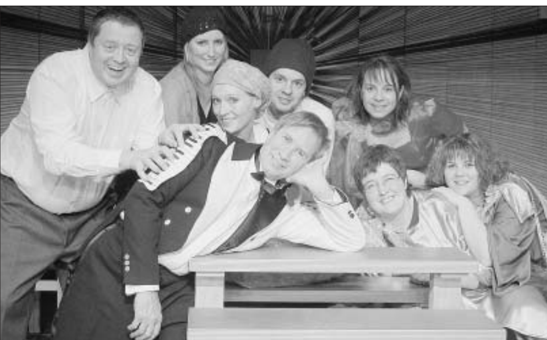
Toute l'équipe des comédiens-chanteurs.

Donc, pour la première fois depuis «Cabarevasion», la troupe théâtrale se remet au cabaret. Le titre fait un grand clin d'œil aux «douze travaux d'Hercule». Les décors, imaginés et réalisés par Michel Mollier et son équipe, évoquent irrésistiblement des gradins d'arène gréco-romains. Mais aussi les vagues montantes et descendantes de la vie d'un homme. Ce que ce cabaret va illustrer, de la naissance à la mort... qui n'est pas une fin. Entre émotion, tendresse et drôlerie. Avec des chansons re-