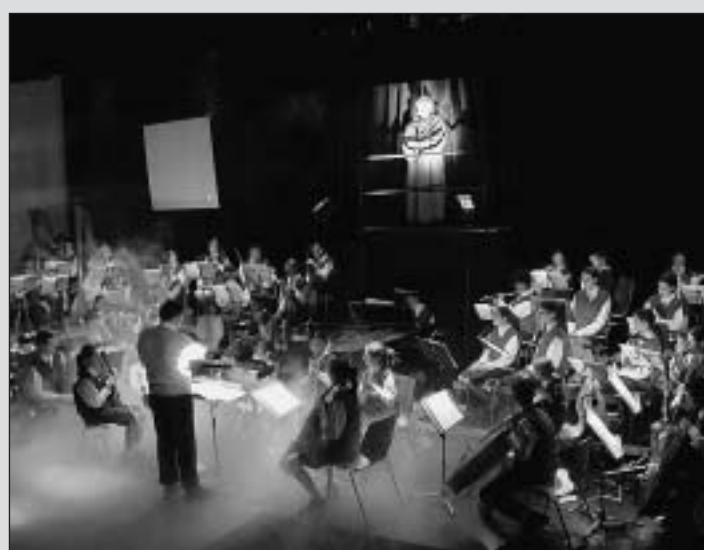
«Athantor», un orchestre d'adolescents.