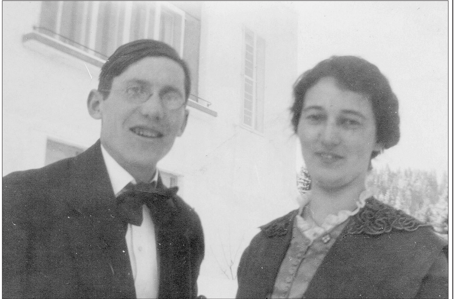
Charles-Edouard Jeanneret et une amie devant la Maison blanche.

Monsieur a ses raisons. Sa maison, dont il a certes accepté lui-même une augmentation du volume, a finalement coûté quelque 300.000 francs, soit le double des devis initiaux! Jeanneret aurait peut-