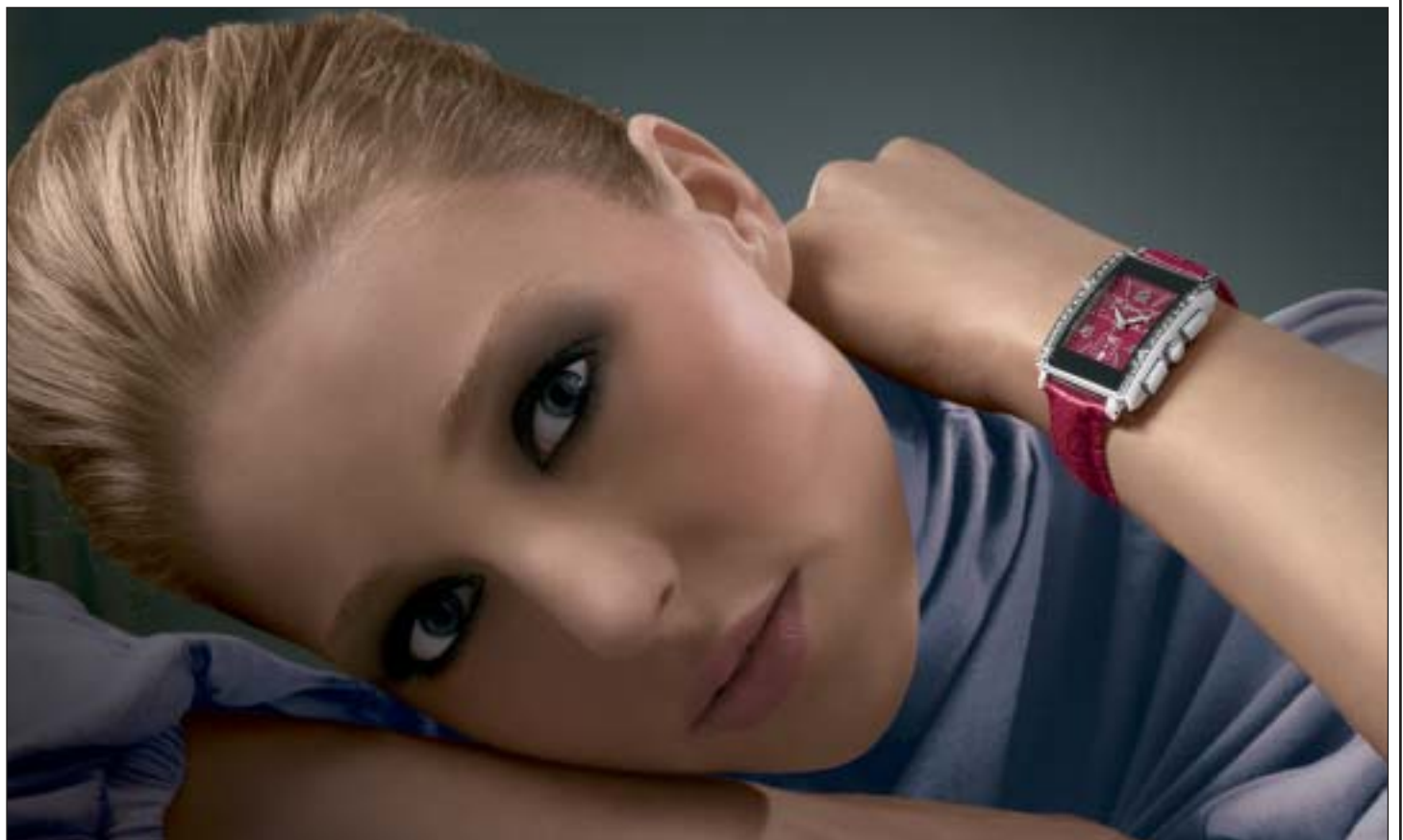
Le chronographe Integral Jubilé de Rado, une pièce qui traduit le savoir-faire de la marque bernoise, reconnue mondialement pour ses produits en céramique et métal dur.