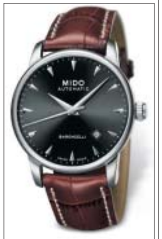
Baroncelli, la grande nouveauté.