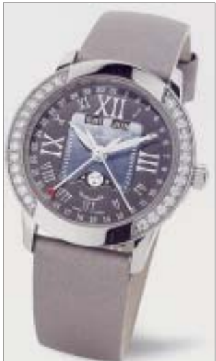
Quantième complet phases de lune dans la ligne Orchidée.