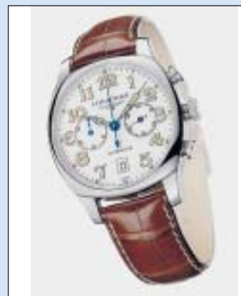
Spirit de Longines, un modèle revisité.

Élégance féminine. Nouvelle collection avec BelleArti. Elle est aussi inspirée par les