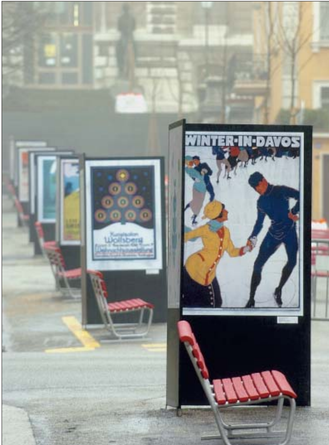
La rue du Collège-Industriel est laissée libre aux piétons jusqu'à la fin du mois de septembre. L'exposition va d'Espacité jusque dans les murs de la bibliothèque.