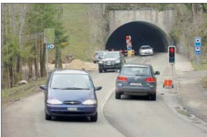
Comme prévu, la deuxième phase des travaux de réfection du tunnel du Châtelard a repris. Cette fois, la circulation est réglée par des feux.

Les feux lumineux détectent les automobilistes par radar, ce qui permet de changer rapidement de phase. /jcp